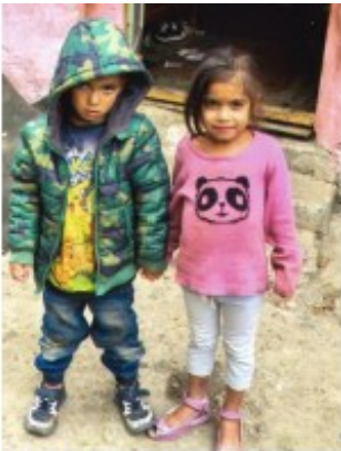
Gr.3a en 3b: